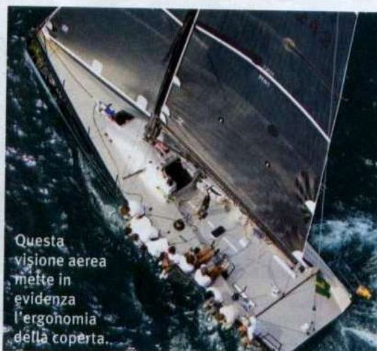
Questa visione aerea mette in evidenza l'ergonomia della coperta.

tata da una zavorra che rappresenta più della metà del dislocamento complessivo e posta a ben 2,6 metri di profondità. Le appendici strette e allungate hanno un ottimo profilo idrodinamico disegnato per offrire la minor resistenza possibile e con un'efficienza che migliora all'aumentare della velocità.